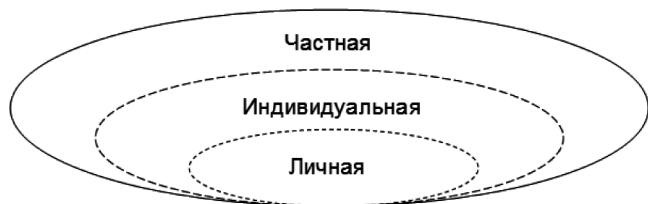
Рис. 1. Единство и границы сущностных отношений исключительной частной собственности

Исходя из сущности рассмотренных категорий, можно сделать вывод о том, что понятие индивидуальная форма собственности шире чем личная, но уже частной. Изложенную логическую последовательность можем наглядно представить в виде схемы (Рис. 1).