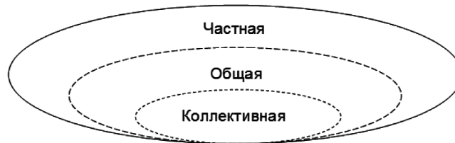
Рис. 2. Границы и единство общности частной собственности

Изложенную последовательность общности частной собственности можно представить схематически (Рис. 2).