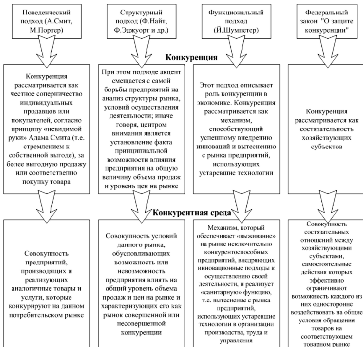
Рисунок 1. Основные подходы к определению понятий "конкуренция" и "конкурентная среда".