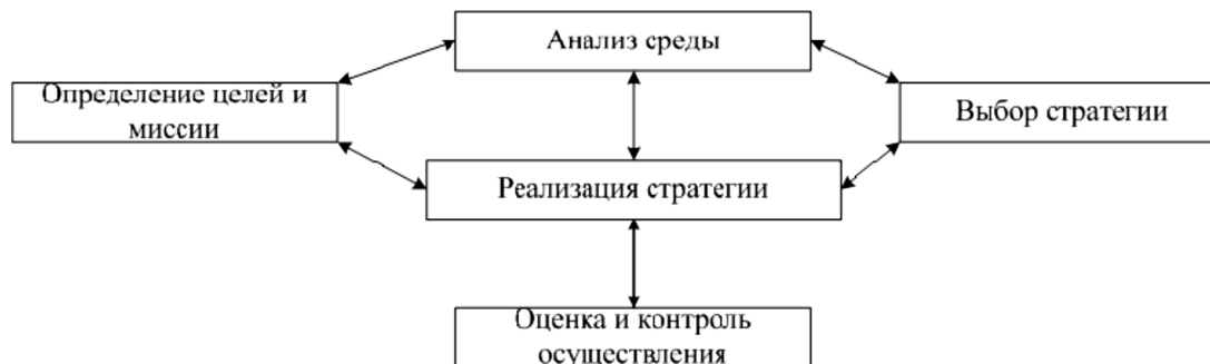
Рисунок 4. Использование результатов анализа конкурентной среды в стратегическом управлении предприятием.