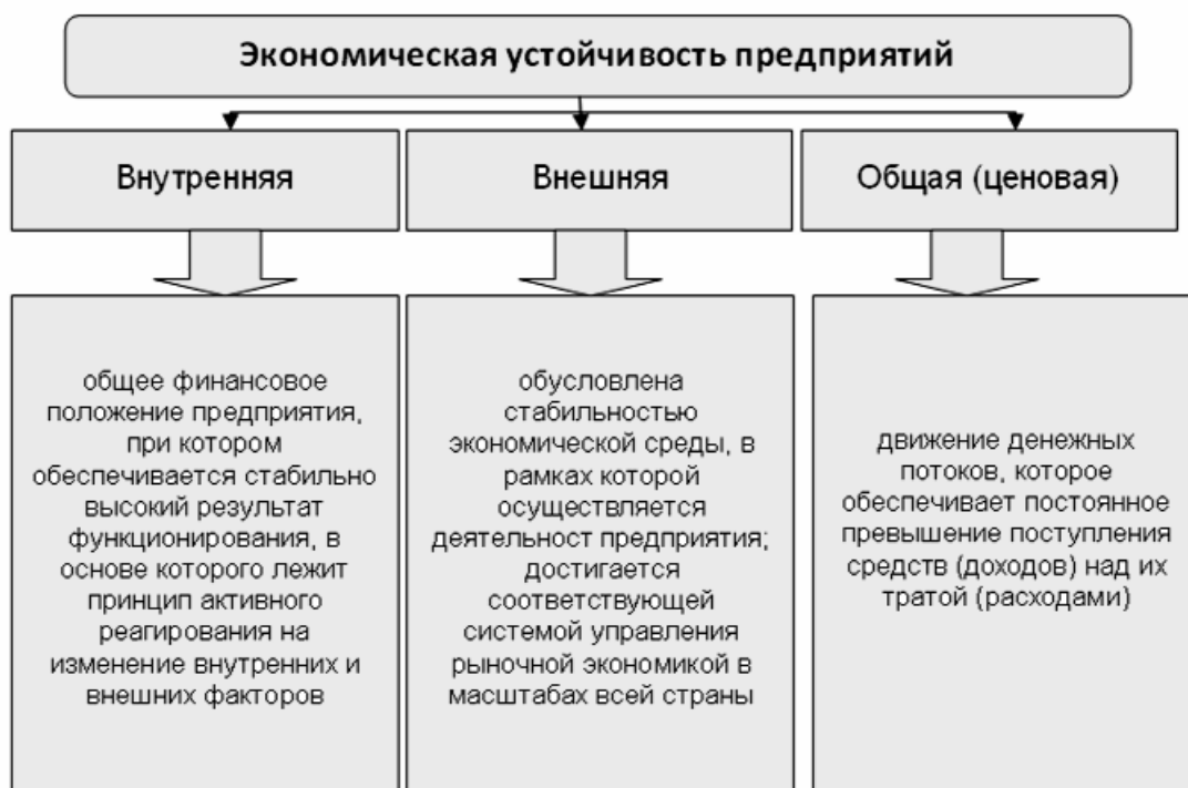
Рис. 2. Классификация экономической устойчивости предприятий в зависимости от влияющих на нее факторов

Факторами постоянства экономического развития предприятия является также ряд угроз и возможностей внешней и внутренней среды. Важными показателями являются: политическое положение, рациональное использование естественно–ресурсного производственного потенциала предприятия, результаты рыночного реформирования отношений собственности, улучшения условий и среды жизнедеятельности населения, сохранения экологической безопасности территории предприятия. Такое разнообразие факторов обуславливает необходимость дифференцирования экономической устойчивости предприятия по видам (рис. 2, с использованием материалов[3, с.8]).