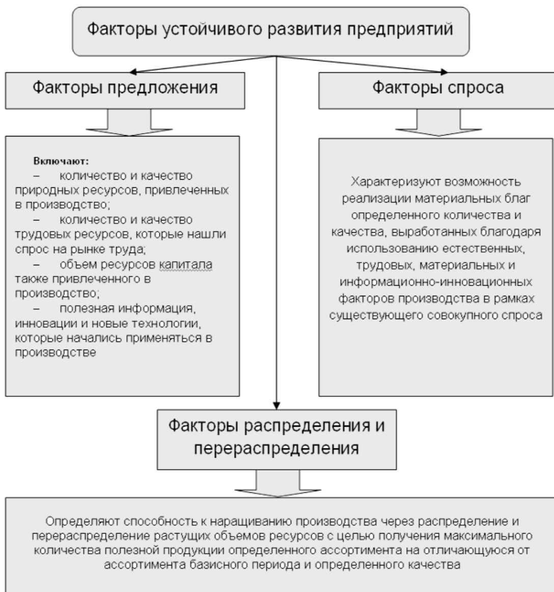
Рис. 1. Классификация факторов устойчивого развития предприятий на основании рыночных категорий спроса и предложения

И наоборот, низкие темпы привлечения инвестиций могут стать главной причиной безработицы.