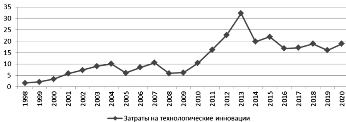
Рисунок 3. - Интерполяция функции "Затраты на технологические инновации".