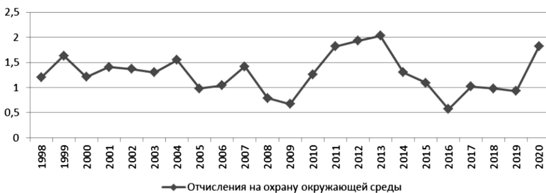
Рисунок 2. - Интерполяция функции "Отчисления на охрану окружающей среды".