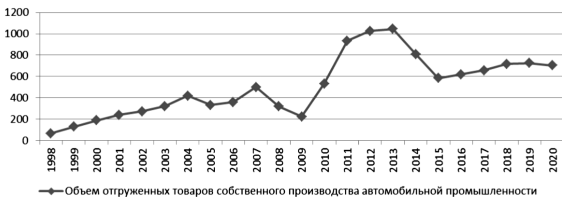
Рисунок 1. - Интерполяция функции "Объем отгруженных товаров собственного производства автомобильной промышленности".