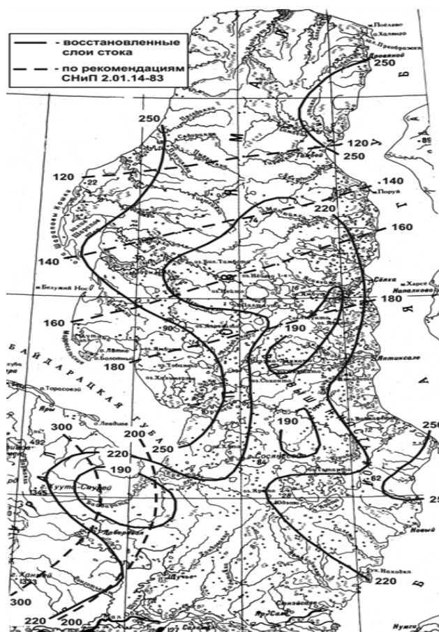
Рис. 2. Среднемноголетние слои стока весенне-летнего половодья.

стока с юга на север. Последнее объясняется, прежде всего, отсутствием режимных наблюдений на реках арктической зоны Западной Сибири и, как следствие – переносом гидрологических характеристик из центральных районов Западной Сибири на совершенно неизученные территории Крайнего Севера. Полученные карты (рис.1, 2) были использованы при разработке методов расчета максимальных расходов воды для полуострова Ямал [1].