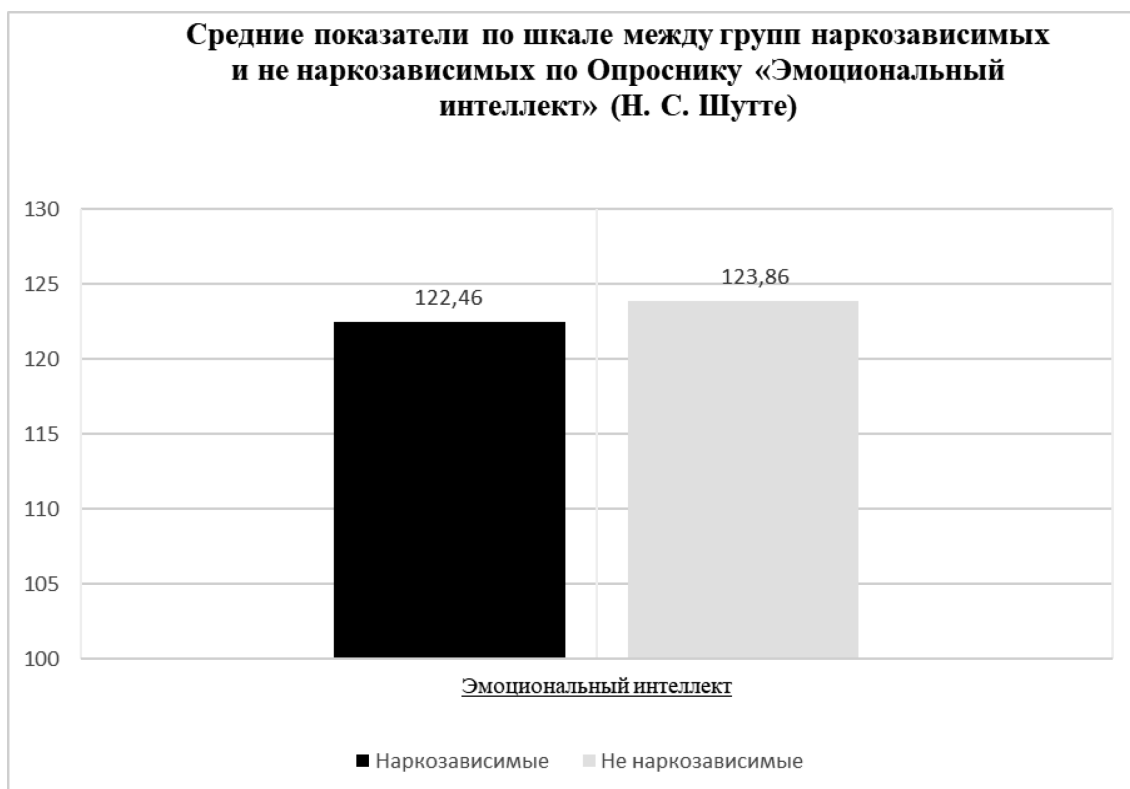
Диаграмма 2. Эмоциональный интеллект. Среднее.