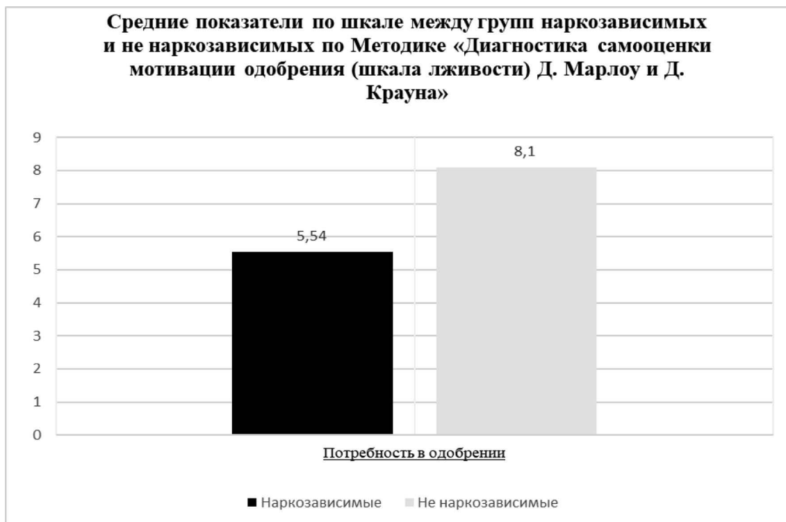
Диаграмма 4. Мотивация одобрения. Среднее.