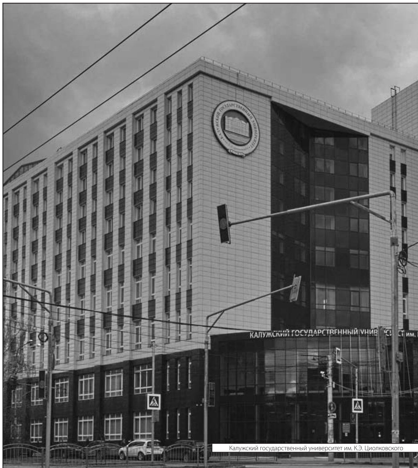
Калужский государственный университет им. К.Э. Циолковского

Журнал «Современная наука: актуальные проблемы теории и практики»