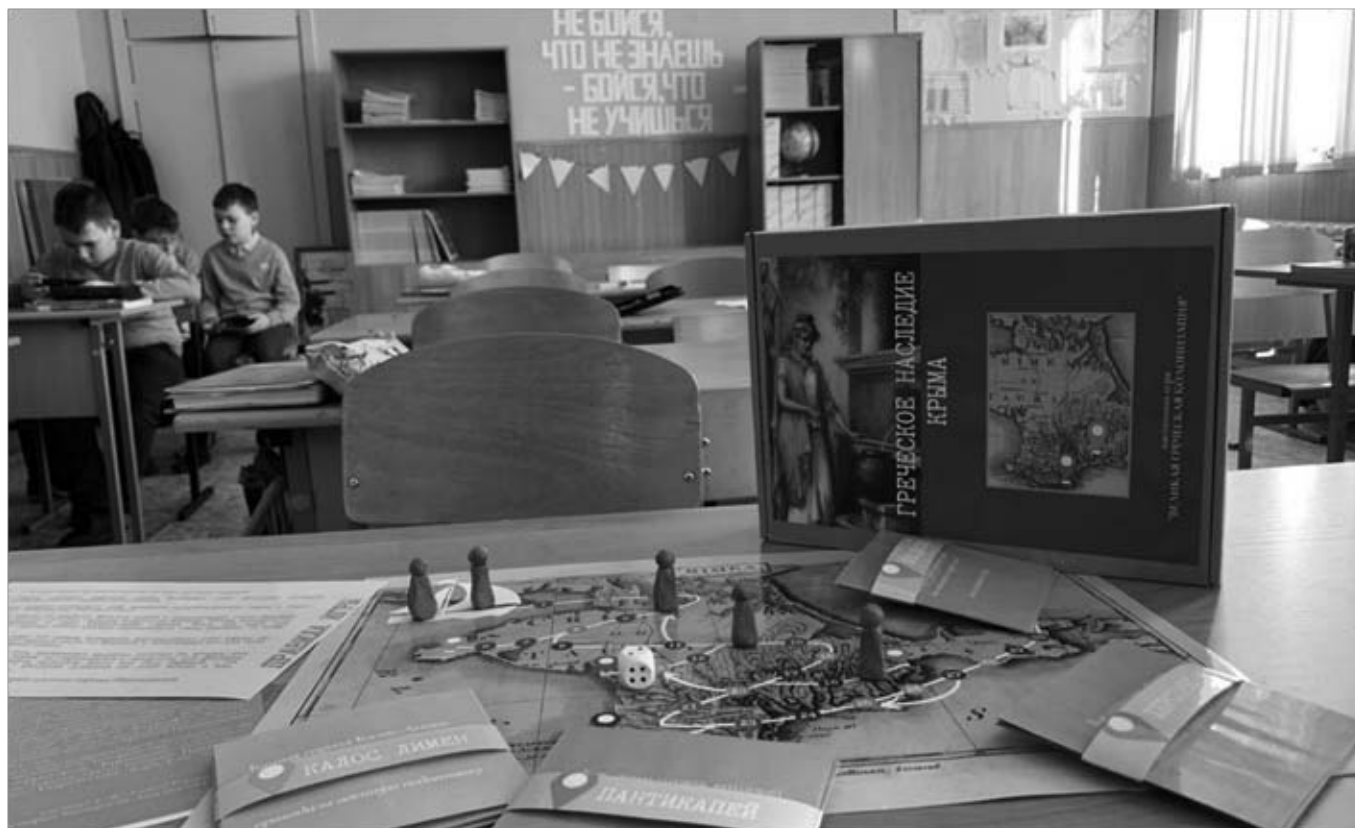
Рис. 1. Набор игры «Греческое наследие Крыма».