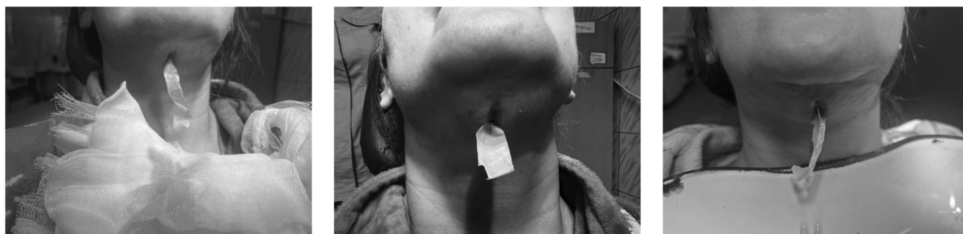
Рис. 3. фотографии пациентки на 1, 5, 8 день лечения

В обоих клинических случаях заболевание развилось после удаления моляров, что соответствует данным литературы о высокой частоте развития одонтогенных флегмон на фоне воспалительных осложнений после экстракции зубов, особенно в области моляров нижней челюсти. Пациенткам была проведена комплексная те-