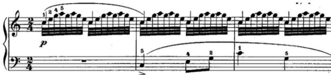
Рис.1. Пример. ор. 636-№ 1. Карл Черни

По сравнению с другими сборниками Этюдов К. Черни, ор. 636 несколько непривычен для многих и часто игнорируется учителями игры на фортепиано[2]. После изучения «Элементарного курса фортепиано» ор.599 и «Этюд беглости игры на фортепиано» ор.849, многие учителя позволяют ученикам сразу играть Этюды «Школы беглости» ор.299 К. Черни для фортепиано, когда длительность и сложность репертуара внезапно возрастает, что затрудняет обучение, и многие студенты не могут