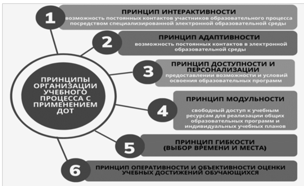
Рис. 2. Принципы организации образования с применением ДОТ

международной и междисциплинарной базой данных, доступной для поиска и публикации научной литературы. База данных Scopus стала с одной стороны хорошей альтернативой для ученых, а с другой конкурентом для WoS. Многие авторы сравнивают системы по качественным и количественным величинам, а именно происхождение, цитирование, особенности поиска, работы в самой системе, импакт-фактор и h-индекс и других [29].