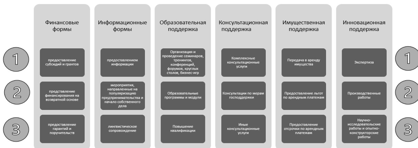
Рис. 2. Рейтинг востребованности среди формы поддержки по данным Единого реестра субъектов малого и среднего предпринимательства — получателей поддержки в части количества получателей поддержки (1, 2 и 3 места по уровню значимости).

в части количества получателей поддержки [2] в настоящее время выглядит следующим образом