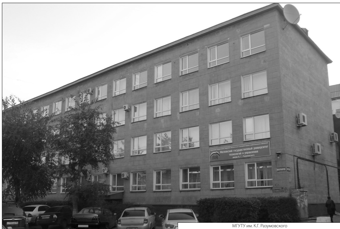
МГУТУ им. К.Г. Разумовского

Журнал «Современная наука: актуальные проблемы теории и практики»