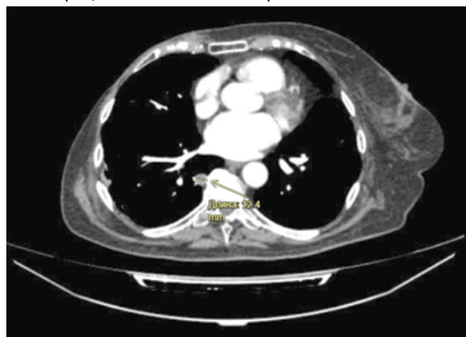
Рис. 1. Томограмма с образованием в нижней доле правого легкого

Пациентка X. с диагнозом саркома тела матки T2N0M0 II ст. Из анамнеза: проведена экстирпация матки с придатками в 2004 году. Прогрессирование в 2012 году — появление метастазов в левом легком. В 2012г. — атипичная резекция верхней доли левого легкого. Прогрессирование в 2016 году — метастазы в правое легкое. 26.01.2016 г. — торакотомия справа, резекция верхней и нижней доли правого легкого. Прогрессирование в 2022 году — новообразование в правом легком. 11.10.2022 год — Краевая резекция нижней доли (S6) правого легкого. 18.11.2022 г. до 01.03.2023 г. — проведение 5 курсов ПХТ по схеме: доксорубицин 50–75 мг/м в 1-й день цикл 21 день. При выполнении КТ от 10.08.2025 года — прогрессирование, образование в области послеоперационных изменений правого легкого.