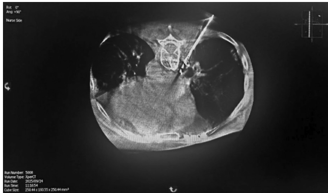
Рис. 2. ПДКТ-контроль позиционирование электрода в образовании

Проведен ЭТН (эндотрахеальный наркоз), положение пациента на животе. Под контролем ПДКТ заведен и позиционирован электрод в опухолевое образование правого лёгкого. На рисунке 2 представлена ангиографическая томографическая картинка расположения иглы в грудной полости и опухоли от абляционного аппарата.