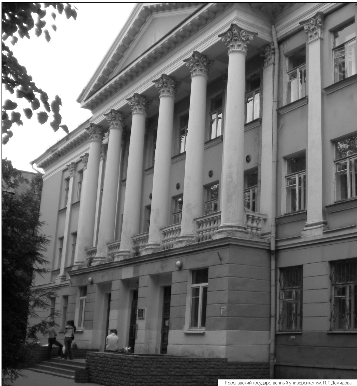
Ярославский государственный университет им. П. Г. Демидова

Журнал «Современная наука: актуальные проблемы теории и практики»