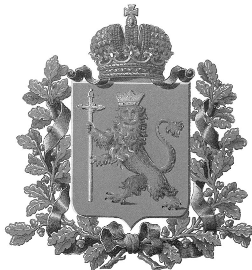
Герб Владимирской губернии

к Москве. К этому же времени вся территория сегодняшнего Владимирского края вошла в состав Московского княжества.