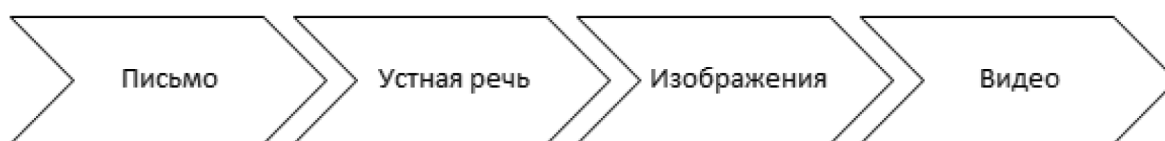
Рис. 3. Основные домены контента