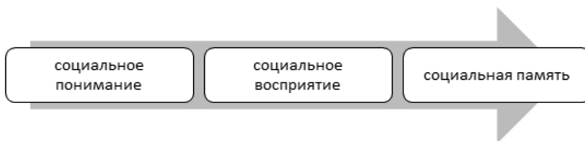
Рис. 4. Аспекты компетенций социального интеллекта, оцениваемые в рамках проведения Магдебургского теста социального интеллекта

конструкции когнитивных способностей, поскольку они не отвечают требованиям универсальной валидности и независимости от контекста. Тем не менее, социальные знания должны быть положительно связаны с другими четырьмя доменами когнитивных способностей социального интеллекта.