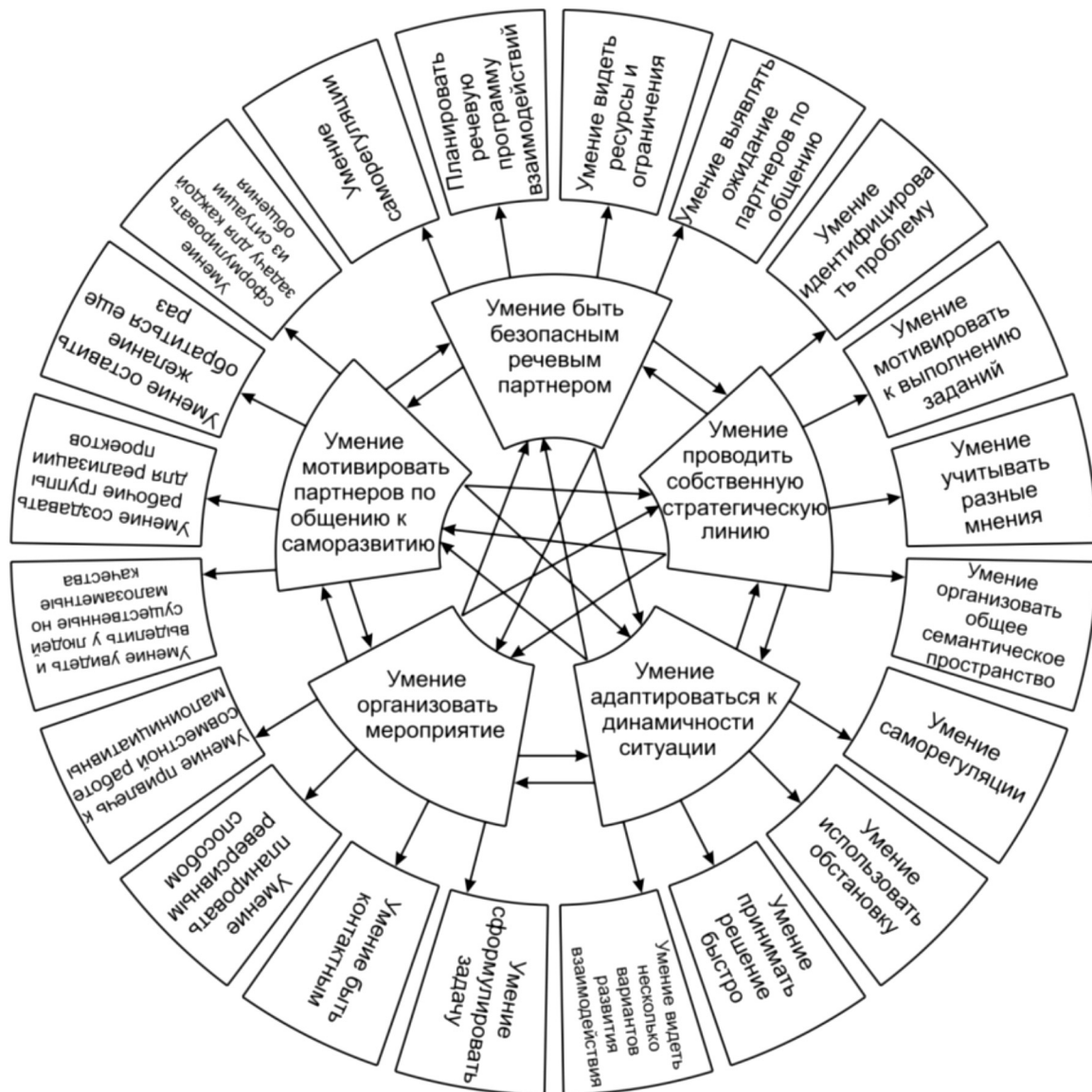
Схема 1. Взаимосвязь ядерных умений коммуникабельности.

бельности менеджера-педагога в процессе дополнительного профессионального образования [7]. Мы исходили из того, что, во-первых, как показал анализ литературы, большинство авторов единодушны в неразделимости понятий "коммуникабельность" и "общение", в определении области функционирования коммуникабельности – непосредственное взаимодействие субъектов общения и формы передачи – словесное сообщение. Во-вторых, методологической основой работы является деятельностный подход, поэтому перечень профессиональных умений менеджера-педагога представлен функционально, то есть характеристики коммуникабельности сгруппированы вокруг функциональных умений, таким образом, показана и доказана широта различных связей