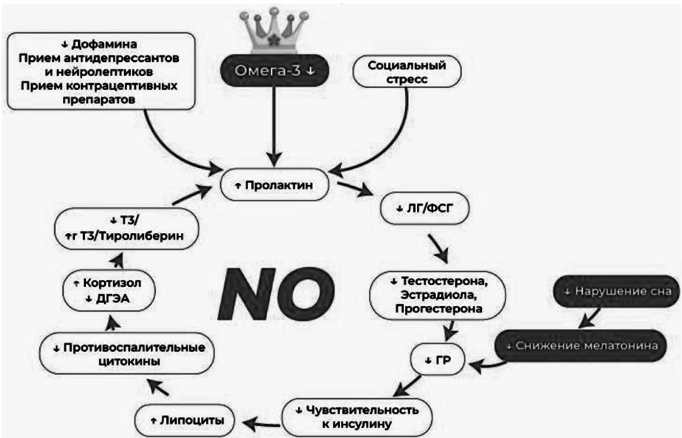
Рис. 2. Влияние дефицита Омега-3 ПНЖК на уровень пролактина и гормональный баланс

Для оценки статуса Омега-3 ПНЖК используется определение Омега-3 индекса методом ВЭЖХ МС/МС — процентного содержания суммы эйкозапентаеновой (ЭПК) и докозагексаеновой кислот от общего количества жирных кислот в мембране эритроцитов [6, 7]. Низкий Омега-3 индекс (менее 8 %) ассоциирован с повышенным риском развития метаболических и эндокринных нарушений, включая гиперпролактинемию [5–7, 35–37].