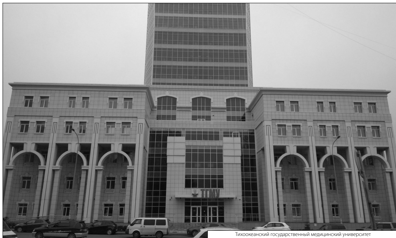
Тихоокеанский государственный медицинский университет

Журнал «Современная наука: актуальные проблемы теории и практики»