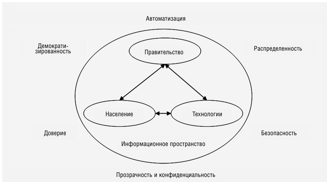
Рисунок 2. Особенности построения инфраструктуры информационного пространства на основе технологии Blockchain.

доверия" в связи с тем, что она обеспечивает доверие между ее участниками. Другими словами, экономическая система, основанная на технологии Blockchain, работает без воздействия человека, что делает транзакцию доверенной. Исторически доверие было основано на бизнесе, включающем надежную третью сторону, что в ряде случаев влекло за собой дополнительные затраты для участников экономической деятельности. Технология Blockchain обеспечивает жизнеспособную альтернативу для устранения посредников, тем самым снижая эксплуатационные расходы и повышая эффективность взаимодействия субъектов экономической деятельности. Таким образом, с технологией Blockchain появилась возможность переосмыслить фундаментальные основы взаимодействия экономических субъектов в мире; иными словами, данная технология послужила толчком для появления новых механизмов цифрового взаимодействия на всех уровнях экономических отношений.