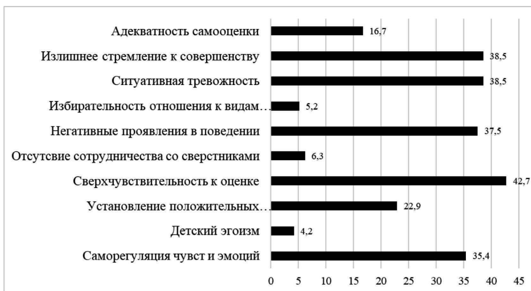
Рис. 1. Результаты исследования проблем одаренных детей на начало учебного года, в %

По результатам исследования были выявлены наиболее распространенные проблемы и определены направления психолого-педагогической поддержки для каждого одаренного ребенка.