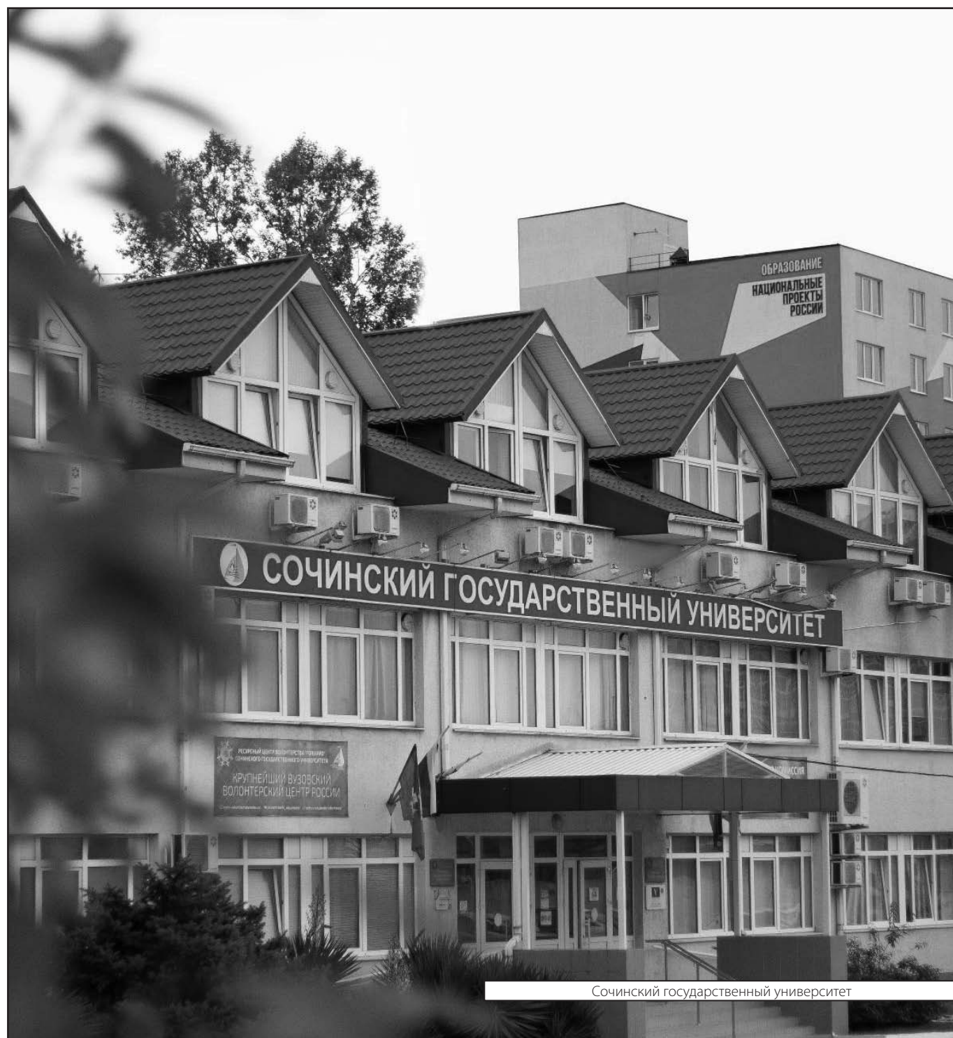
Сочинский государственный университет

Журнал «Современная наука: актуальные проблемы теории и практики»