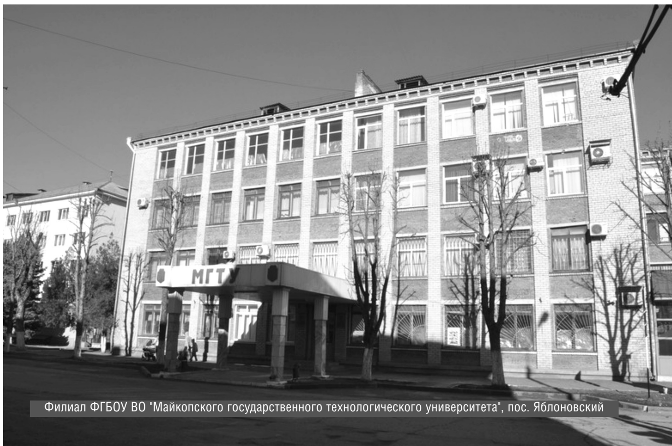
Филиал ФГБОУ ВО "Майкопского государственного технологического университета", пос. Яблоновский

© И.Н. Чувев, Ю.А. Лысенко, З.Ч. Гучетль, В.А. Хрисониди, ( hrisonidi_vital@mail.ru ), Журнал «Современная наука: актуальные проблемы теории и практики»,