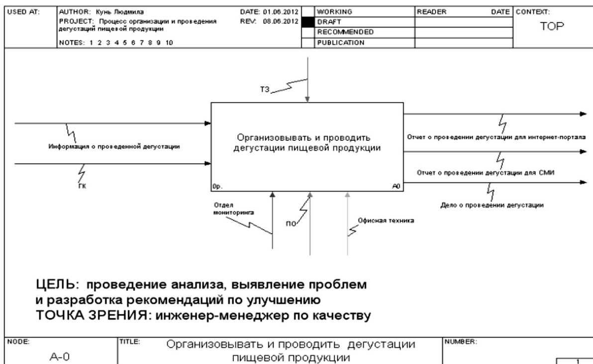
Рисунок 1. Блок-схема процесса "Организация и проведение дегустации пищевой продукции".