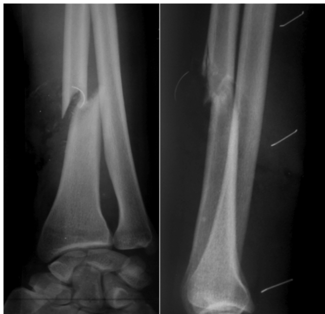
Рис. 1. Перелом левой лучевой кости на границе средней и нижней трети

По классификации Gustilio-Anderson (1976) перелом отнесен к IIIA степени. После краткосрочной предоперационной подготовки пациенту выполнено оперативное лечение: ПХО раны левого предплечья, открытая репозиция костных отломков левой лучевой кости, во время которой длина и изгиб лучевой кости восстановлены, выявлен дефект кости размером 1,2×1×0,6 см. Костные отломки фиксированы спицей. Далее выполнен шов сухожилий длинного лучевого разгибателя запястья, плечелучевой мышцы, лучевого сгибателя запястья, поверхностного сгибателя пальцев, длинного сгибателя I пальца левой кисти, фиксация костных отломков левой лучевой