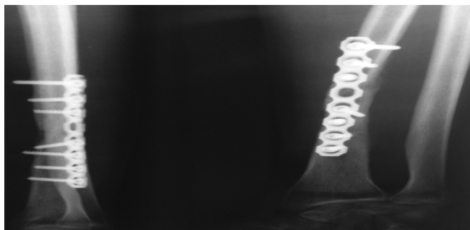
Рис. 3. Выполнен накостный остеосинтез пластиной с костной аутопластикой