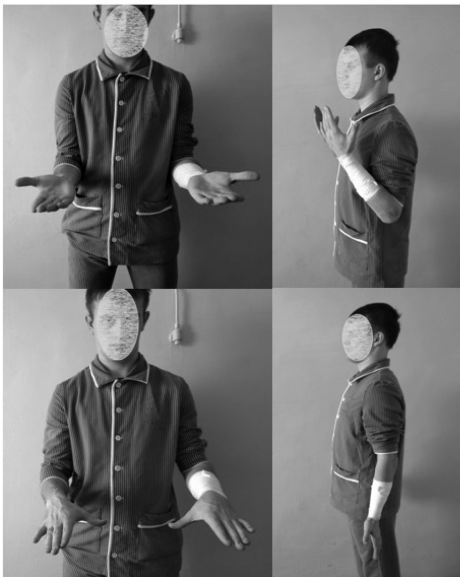
Рис. 5. Функция левой верхней конечности после удаления пластины

громоздкие, требуют постоянного ухода, что причиняет неудобства пациенту. Отрицательные черты внеочагового остеосинтеза побуждали травматологов к поиску новой тактики лечения открытых диафизарных переломов костей предплечья. В настоящее время для данных повреждений применяется этапное лечение. На первом этапе осуществляется внеочаговый остеосинтез до заживления мягких тканей. Вторым этапом выполняется конверсия внеочагового остеосинтеза на погружной остеосинтез (интрамедуллярный или накостный) [17]. Одной из причин развития осложнений и неудовлетворительных результатов, по мнению многих авторов, являются дефекты организации и технические ошибки при лечении пациентов с диафизарными переломами костей предплечья: неправильная тактика лечения, неверный выбор способа остеосинтеза и металлоконструкции, чрезмерная травматичность оперативного вмешательства, недостаточная стабилизация костных