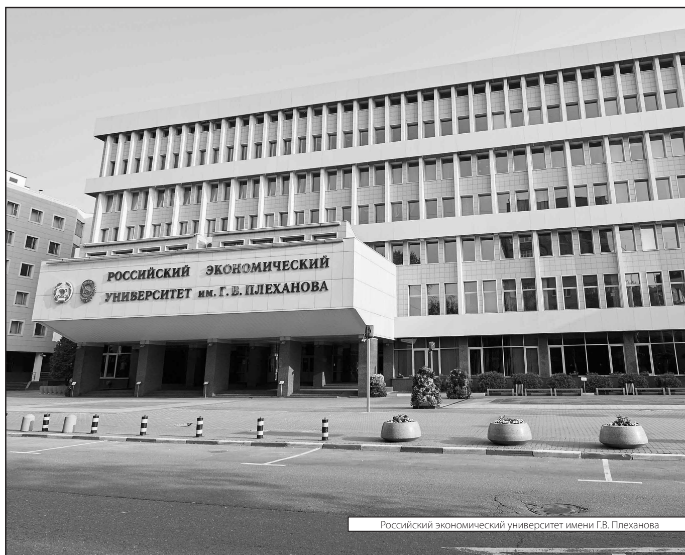
Российский экономический университет имени Г.В. Плеханова

Журнал «Современная наука: актуальные проблемы теории и практики»