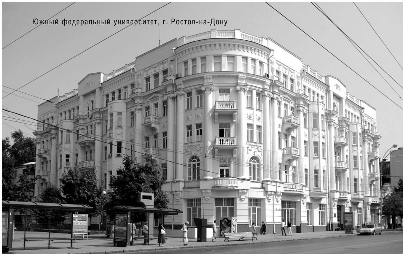
Южный федеральный университет, г. Ростов-на-Дону

© Н.А. Косолапова, ( nakosolapova@sfnedu.ru ), Журнал «Современная наука: Актуальные проблемы теории и практики»,