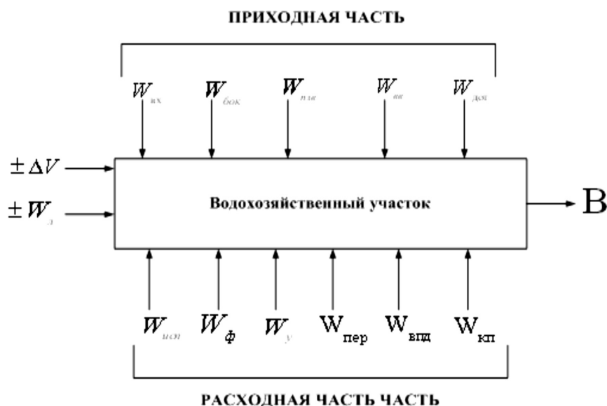
Рисунок 1. Концептуальная схема движения водных ресурсов через водохозяйственный участок.

Автором предложен отличный от существующих подход к выполнению водохозяйственных расчётов, определяющих соотношение располагаемых водных ресурсов (объёмов поверхностных и подземных вод, доступных для использования) и расчетного водопотребления для конкретного водохозяйственного участка. В рамках этого подхода расчёт объёмов располагаемых водных ресурсов для конкретного водохозяйственного участка рассматривается в классе задач в условиях со случайно изменяющимися входными параметрами, составляющими приходную и расходную части уравнения водохозяйственного баланса. Концептуальная схема движения водных ресурсов через водный объект, в роли которого выступает водохозяйственный участок, представлена на рис. 1.