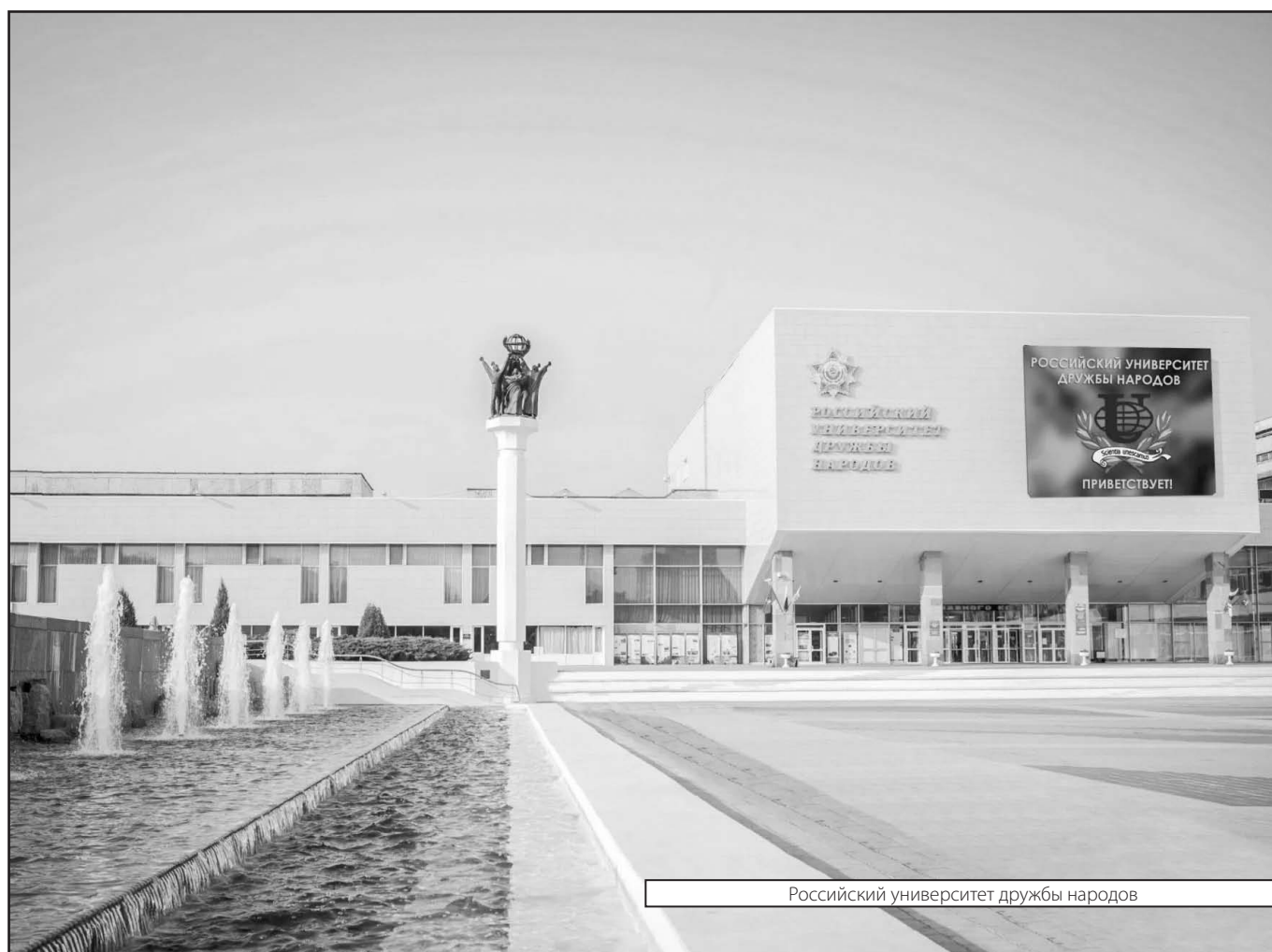
Российский университет дружбы народов

Журнал «Современная наука: актуальные проблемы теории и практики»