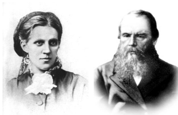
Анна Григорьевна Достоевская (1871 г.) Федор Михайлович Достоевский (1878 г.)

Анна Григорьевна чистосердечно признавалась: "Я далеко не все понимала в его писаниях. Нужно было видеть, с каким терпением он объяснял мне труднейшие философские страницы своих романов. Однажды я созналась ему, что не вполне понимаю "Легенду о Великом инквизиторе". Он словно огорчился и начал подробно, медленно, почти наглядно разъяснять мне смысл этой главы. – "Ну как, Аня, теперь понимаешь?" – Понимаю, но все же не могла бы тебе рассказать. – "Это тебе кажется, это у тебя недостаток формы выражения, но я вижу, что ты поняла, что тебе стал близок мой замысел"" [2].