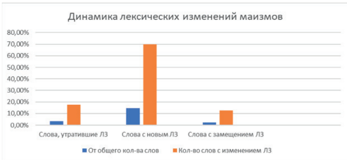
Рис. 2. Динамика лексических изменений маизмов

современном этапе развития языка. Наибольшей группой являются слова с приобретенными лексемами (70%), далее расположилась группа слов, утративших одну или несколько лексем (14,5%). Наименьшее количество слов в третьей группе (12,5%), в которой представлены слова, практически полностью изменившие свои значения.