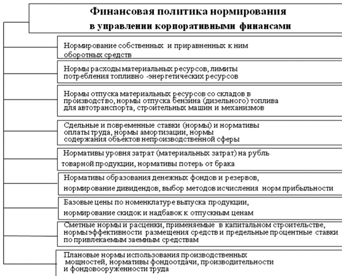
Рис.2 Примерный состав норм, нормативов и лимитов как инструментов проведения финансовой политики нормирования в корпоративном управлении

труды не снимают вопрос о решении стратегической задачи развития науки о корпоративных финансах в части обновления ее содержания, а также внесения корректировок в зарубежные подходы и трактовки по ряду актуальных вопросов корпоративных финансов.