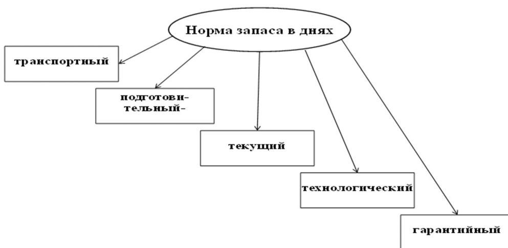
Рис.3 Состав нормы запаса в днях по большинству материальных запасов оборотных средств

Стратегия развития науки о корпоративных финансах предполагает введение и обоснование новых понятий и акцентов в управлении. Принципиальные основы плани- рования запасов и управления нормированием оборот- ных средств нашли отражение в рис.4. Понятие управле- ния нормированием оборотных средств содержит идею непрерывности управления этим процессом.