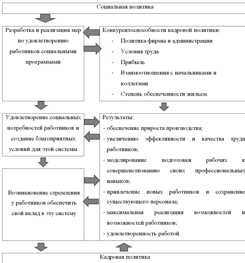
Рис. 2. Механизм взаимодействия социальной и кадровой политики на основе влияния факторов конкурентности и удовлетворенности работой [6, с. 230, 7]