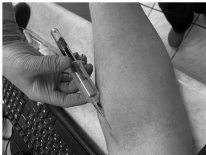
Рис. 2. Забор крови пациента до операции в гепариновую пробирку

Всем пациентам проводили исследование человеческой миелопероксидазы в плазме до операции и после. (Рисунок 2).