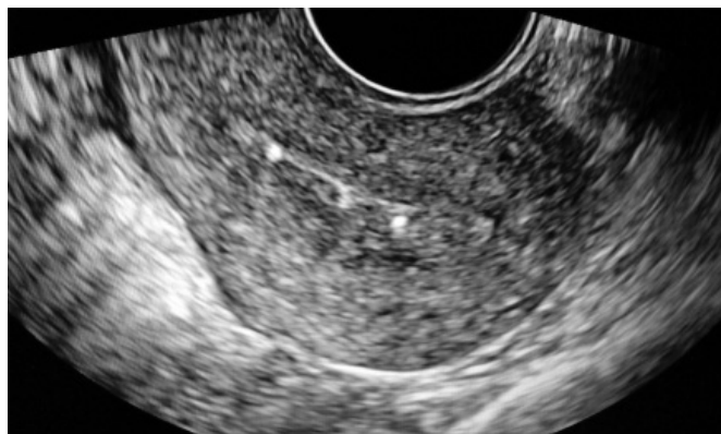
Фото 1. УЗ-скан эндометрия на 14 сутки М-ЭХО- 3-мм с гиперэхогенными включениями в базальном слое эндометрия, без васкуляризации