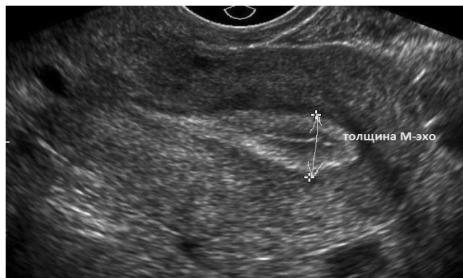
Фото 3. Эндометрий после процедуры «Plasmolifting»

В контрольной группе (с мужским фактором бесплодия) беременность наступила в 100% случаях, в 23% наступила после криопереноса со 2 попытки, и в 77% после ЭКО- с 1 попытки.