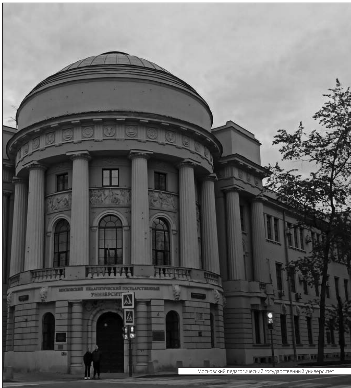
Московский педагогический государственный университет

Журнал «Современная наука: актуальные проблемы теории и практики»